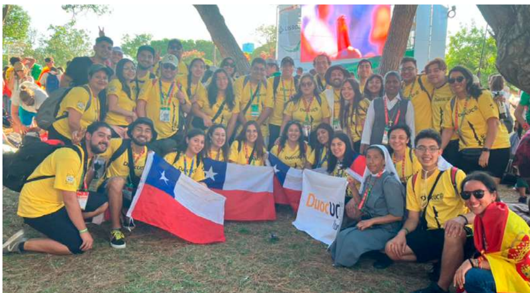
Foto 2: Visita a Portugal a reunirnos con el Papa Francisco y su llamado a millones de jóvenes.