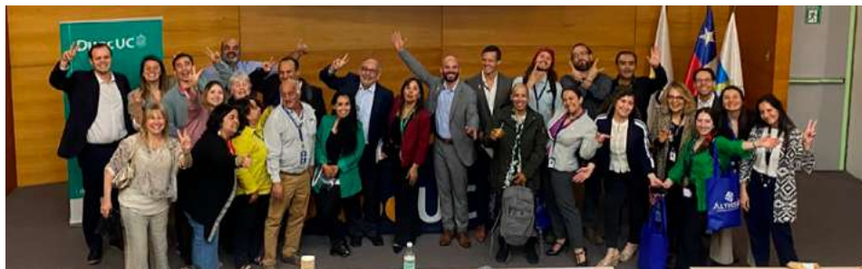
Foto 2: Cierre Plan de Formación Docente 2023.

transversales (idiomas), para poder cerrar las brechas establecidas. Entre los cursos que se dictaron destacan la continuidad del curso New Hospitality Mindset y una serie de certificaciones de carácter nacional e internacional. Los cursos tuvieron un alcance de 92 docentes, de los cuales 77 realizaron los cursos planificados, representando un 84% del total, superior al resultado esperado de un 75%.