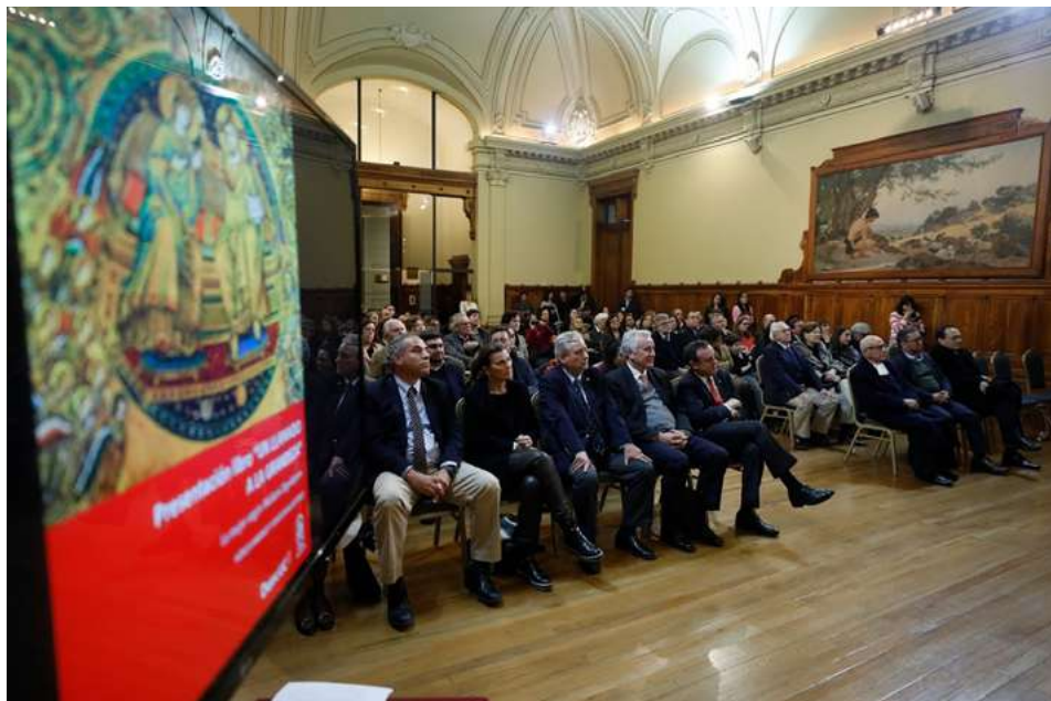
Foto 3: Autoridades en lanzamiento libro Un llamado a la grandeza. La mujer según Mulieris Dignitatem