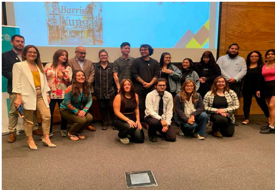
Foto 3: Cierre Proyecto Barrio Yungay.

equipo de VcM (Gestión de proyectos) Duoc UC. Se entregan los productos asociados comprometidos a Podcastour y circuitos turísticos.