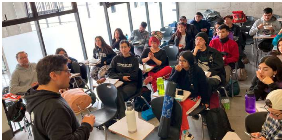
Foto 1: Estudiantes y titulados participan en certificación habilitante ECSI.