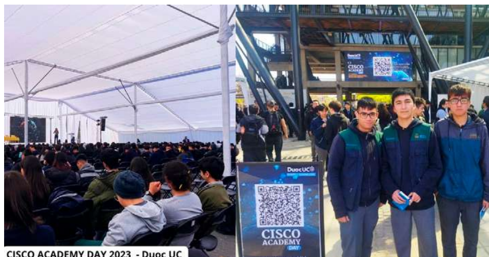
Foto 2: Actividades de vinculación con el medio en la sede Maipú de Duoc UC.

Por otra parte, otro de los hitos que marcó nuestro reciente año fue el Cisco Academy Day , que se realizó en el mes de septiembre, donde alrededor de 600 estudiantes de enseñanza media y casi 400 estudiantes de educación superior, participaron de la realización de un seminario, clases magistrales y workshops .