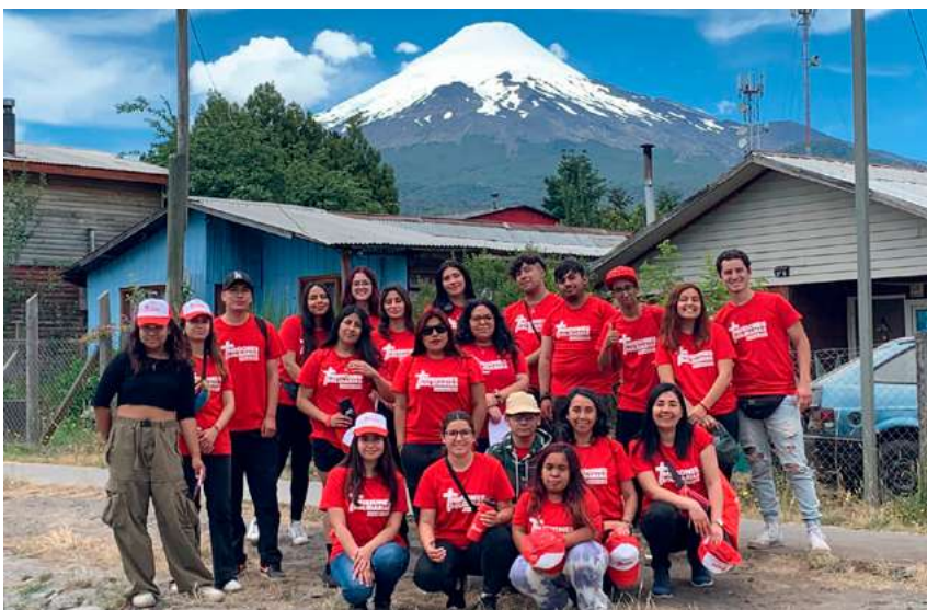
Foto 1: Semana Santa y la Misión interna también estuvo íntimamente ligada a María.

Durante el mes de enero nuestras misiones de verano en el sur del país marcadas por su compañía, iniciamos marzo y el 8m destacamos a la Virgen como modelo de mujer, luego junto a la fiesta de San José estrenamos la oración por el año de María.