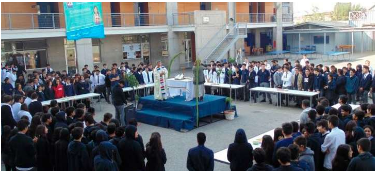
Plan de Mejoramiento Educativo (PME)

Lo anterior en el entendido que todos los Sostenedores del país tienen la obligación de cumplir con la normativa educacional, cumplir también con los estándares de aprendizajes y velar que el compromiso de calidad con la comunidad escolar se cumpla a luz del PEI.