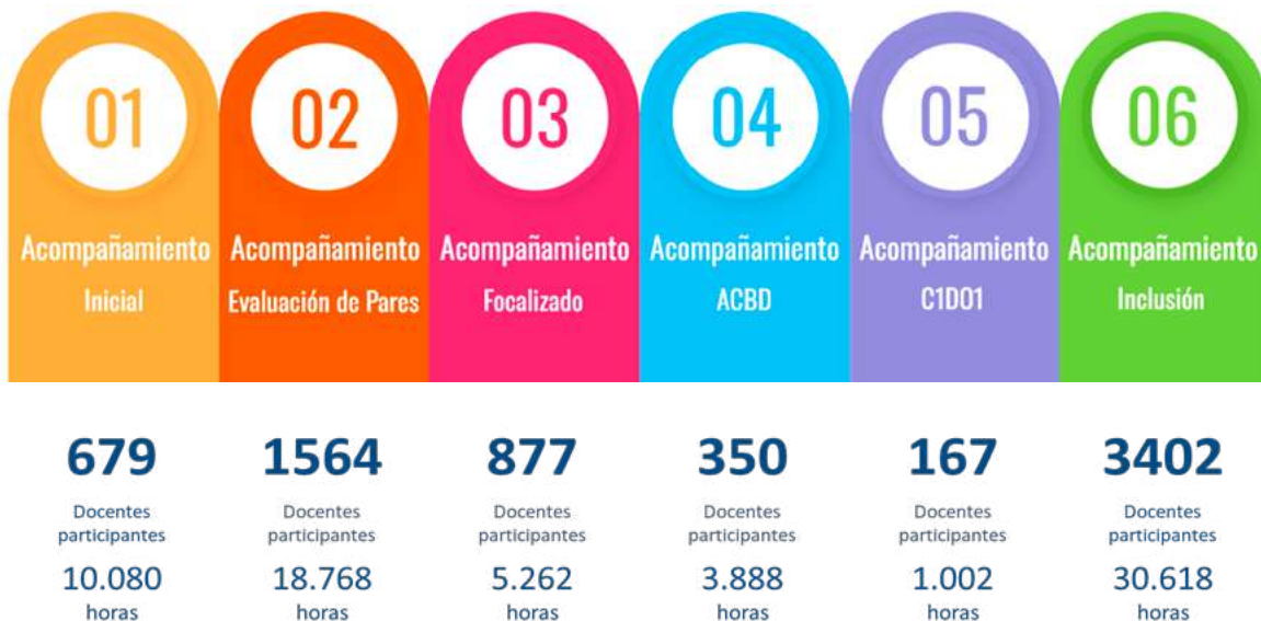
7032 docentes acompañados por UAP 2023

Síntesis general de los acompañamientos destacando las más de siete mil atenciones desarrolladas como se muestra en la siguiente imagen.