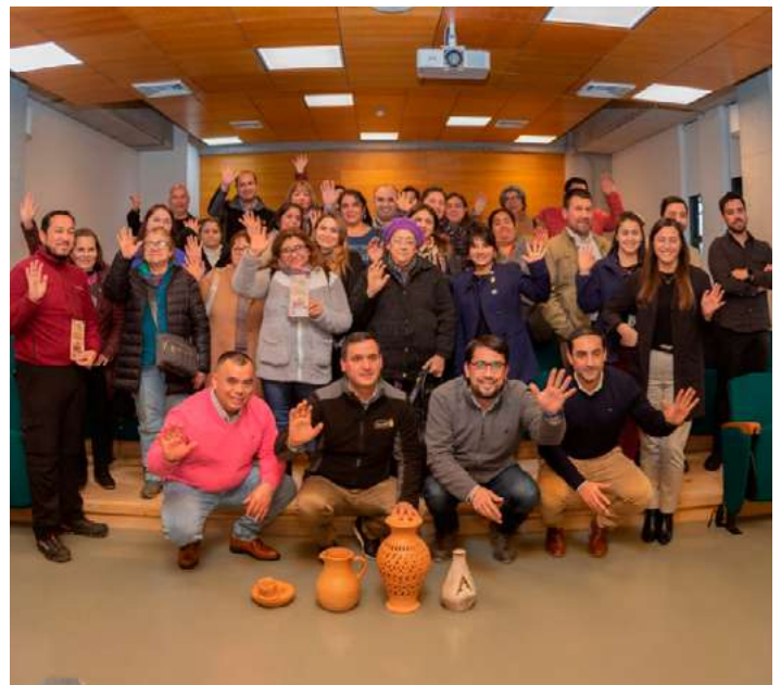
Foto 5: Lanzamiento de actividades colaborativas entre el Municipio de Nacimiento, CMPC, estudiantes, docentes y director de carrera de la Escuela de Diseño para el fortalecimiento del gremio alfarero de la zona.