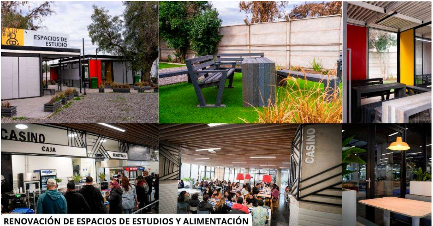
RENOVACIÓN DE ESPACIOS DE ESTUDIOS Y ALIMENTACIÓN