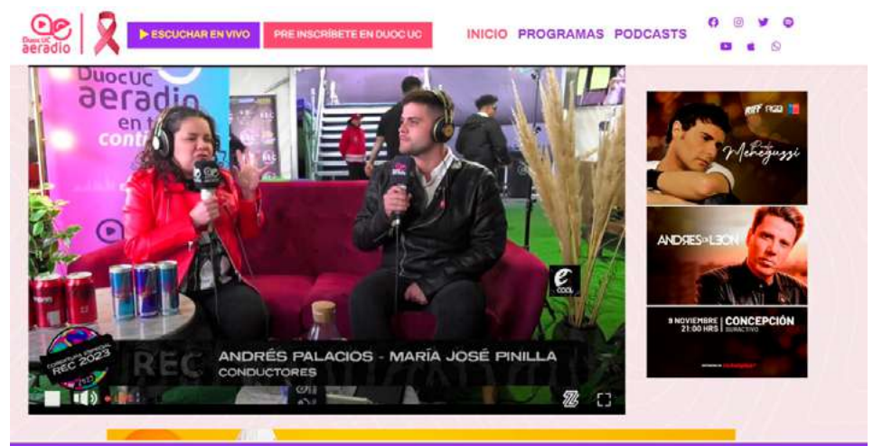
Foto 3: En alianza con el Teatro Biobío, el equipo de alumnos, titulados y colaboradores de AERadio y la Escuela de Comunicaciones dieron vida a “Escenario Central”, programa estelar que permitió compartir los detalles del Festival Rec de Arica a Punta Arenas.